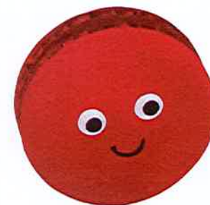
Petit rond rouge

D'autres moments sont à partager avec Claire Zucchelli-Romer lors des rendez-vous publics.